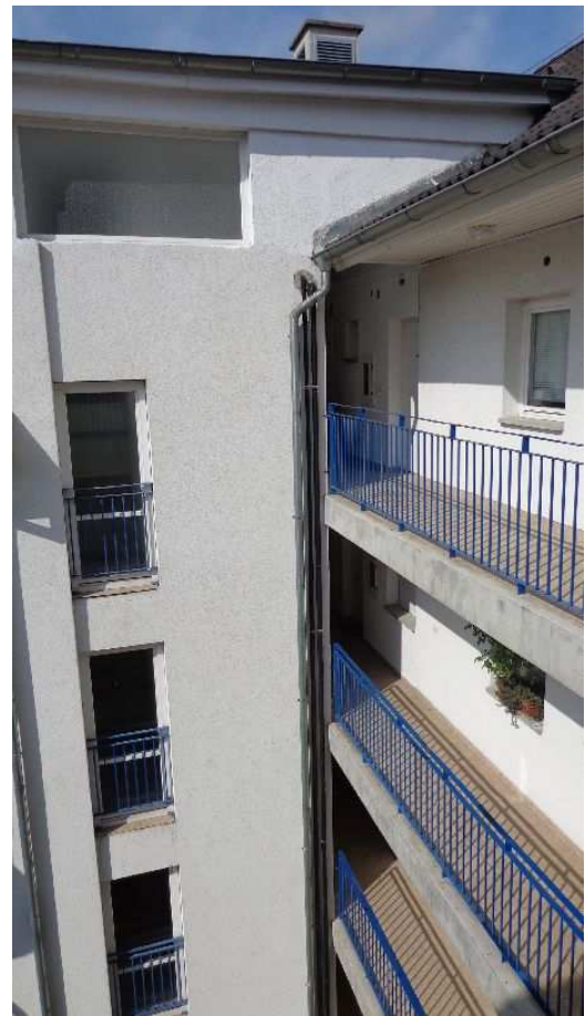
3. kép: szolár csövek az ereszcatorna mellett

A szabadban haladó szolár-csövek csőhéjait megfelelő védőburkolattal kell ellátni! (pl. az ereszcatorna mellett is, a napkollektoroknál is) Ez egyértelmű kivitelezési hiba, a kivitelezőnek sürgősen és díjmentesen ki kell küszöbölnie a hibát.