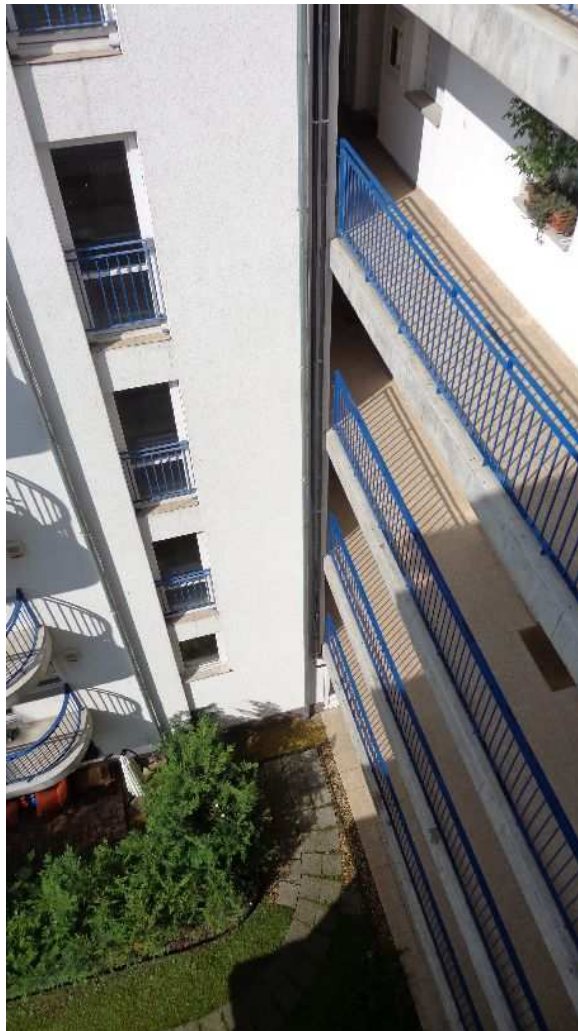
1. kép: a 24 lakásos 5 szintes épület a belső udvar felől