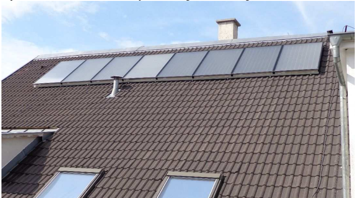
2. kép: a beépített 8 db kollektor a tetőn

A mellékelt „V2024 ... szerződés ...” 9. és 10. oldala különösen félrevezette a megrendelőt. Ugyanis a szerződés 9. oldala napi 1.9 \text{ m}^3 = 1900 liter nap melegvíz-fogyasztásról ír, a 10. oldal első sora pedig arról ír, hogy a szolár rendszer miatt a HMV gázenergia 60%-a megtakarítható lesz. Miközben a szerződés 7. oldala szerint csak 8 db bruttó 2,1 \text{ m}^2 -es napkollektor lesz és ennek kellene teljesítenie az ígért és leírt energiahozamot.